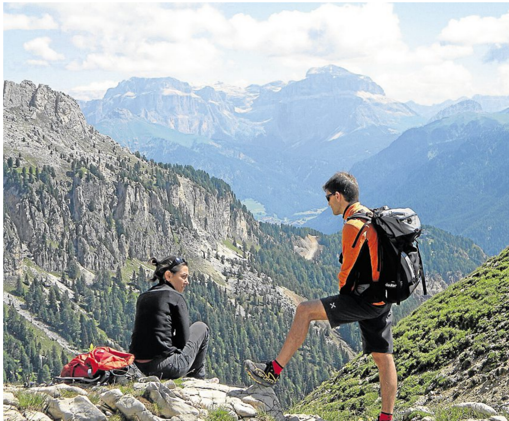
Dolomiten in Vollendung: Unweit der Rotwandhütte hoch oben im Rosengarten bietet sich dem Wanderer dieser herrliche Blick auf das ferne Marmoladmassiv. Dieses überragt mit 3342 Metern die höchste Erhebung des Rosengartens um gut 300 Meter.

Am Tag darauf trifft Pichler seine neue Bekanntschaft samt Eltern am verabredeten Treffpunkt wie-