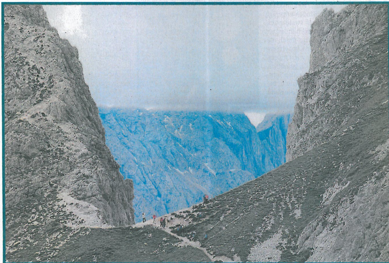
Beeindruckendes Felsmassiv: Der Cigoladepass öffnet den Rosengarten in Südtirol ein klein wenig. Allzu lange wird die verdiente Rast nach dem Aufstieg nicht sein, dunkle Wolken drücken bereits von oben.

So eingestimmt gehen wir los. Fünf Stunden werden wir unterwegs sein, werden über den Cigoladepass gehen und große Teile des Rosengartens umrunden. Rund zehn Kilometer, 700 Höhenmeter, es ist ein Klassiker unter den Wanderungen in den Dolomiten. Und geführt. Nach der Panne mit dem Navi (menschliches Versagen nicht ausgeschlossen) haben wir beschlossen, uns einem Wanderführer anzuvertrauen. Herbert heißt er, ist