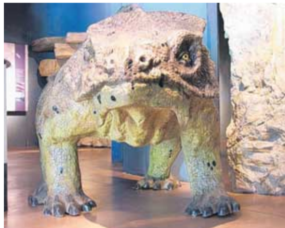
Im Besucherzentrum steht der Saurier Pachycephalosaurus in voller Größe.

nen Jahren im heutigen Südtirol heimisch waren. Das lag damals übrigens noch am Äquator, die Kontinentalverschiebung hat das längst geändert. Heute geraten Paläontologen ins Schwärmen, wenn sie von der Bletterbachschlucht sprechen, gilt sie doch