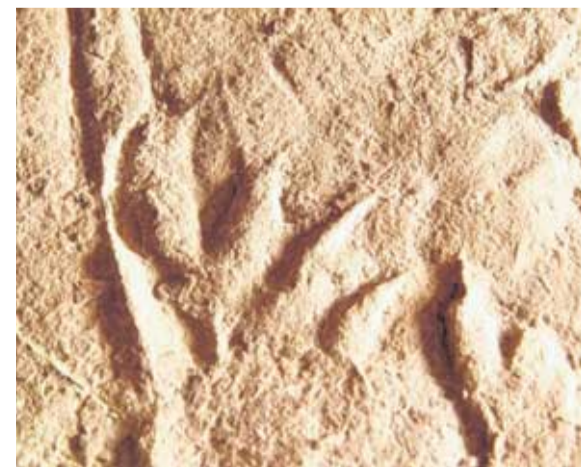
Die Saurierspuren faszinieren Wissenschaftler und Laien gleichermaßen.

sondern auch ganz normale Touristen. Der eigens eingerichtete Geoparc Bletterbach verfügt über ein Besucherzentrum, einen Waldlehrpfad und einen Geoweg. Letzterer lässt sich in etwa drei bis vier Stunden erkunden, unterwegs gibt es Informationen