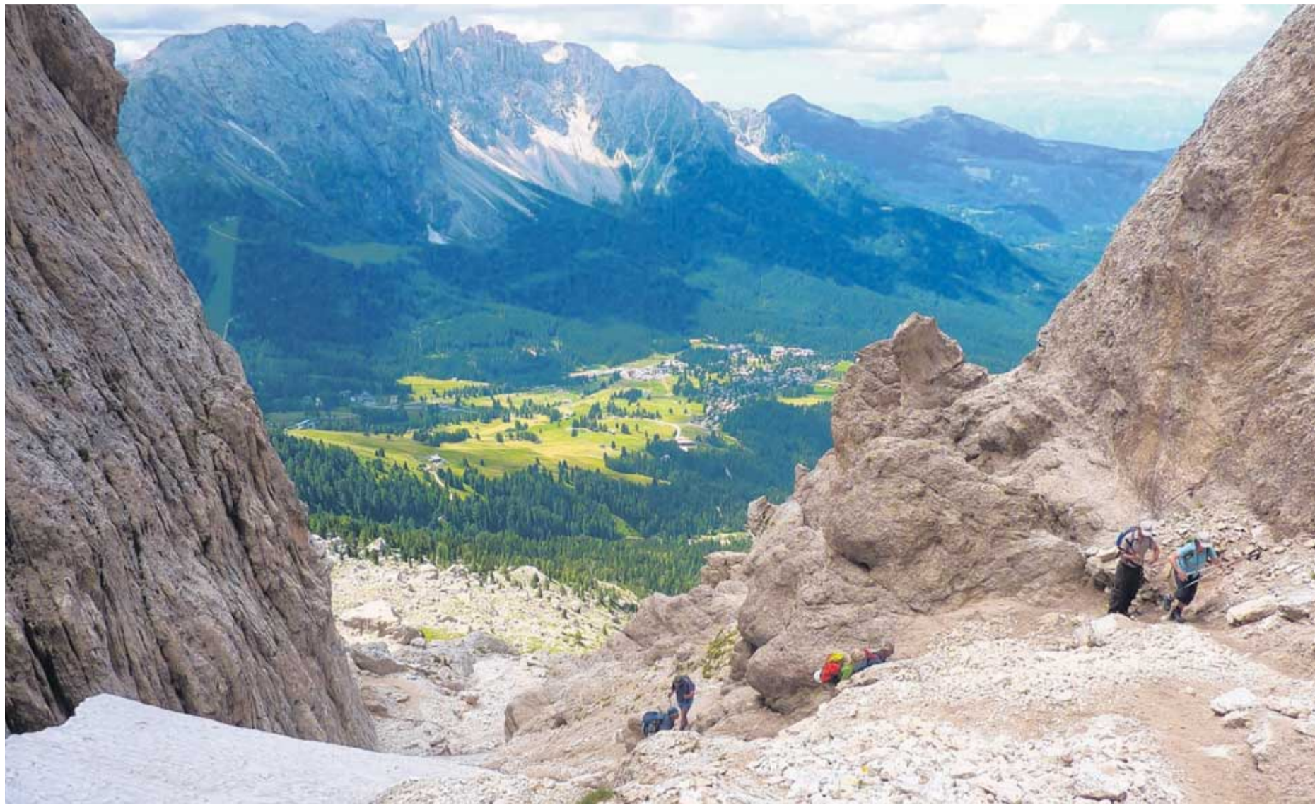
Spannendes Bergwandern: Der Vajolonpass im Rosengarten ist zwar nichts für kleine Kinder – aber wunderschön. Gegenüber die Latemar-Gruppe.

„Das ist oft der Trugschluss, wenn man vom Urlaub in den Bergen spricht: Es muss nicht immer die große Herausforderung sein. Es ist doch klar: Nicht jeder kann jede Tour laufen“, sagt Herbert Pichler, der seit fast sechs Jahrzehnten seine Heimat durchwandert, „und es müssen ja auch nicht immer