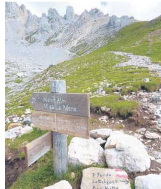
Leichtes Naturerlebnis: Von Alm zu Alm, stets am Latemar entlang, oberhalb von Obereggen.

Reiseziel: Die wellige Hochfläche am Fuß des Latemars und der Eggentaler Berge ist ein Waldgebiet, das, von einigen tiefen Tälern durchbrochen, im Westen steil zum Etsch-Tal abfällt. Weit verstreut liegen Deutschnofen (1350 Meter), Eggen (1120 Meter), Obereggen (1550 Meter), Birchabruck (870 Meter), Rauth (1280 Meter) sowie Petersberg (1380 Meter) mit dem Wallfahrtsort Maria Weißenstein. Seit 2009 gehören Teile der Südtiroler Dolomiten zum Unesco-Weltnaturerbe,