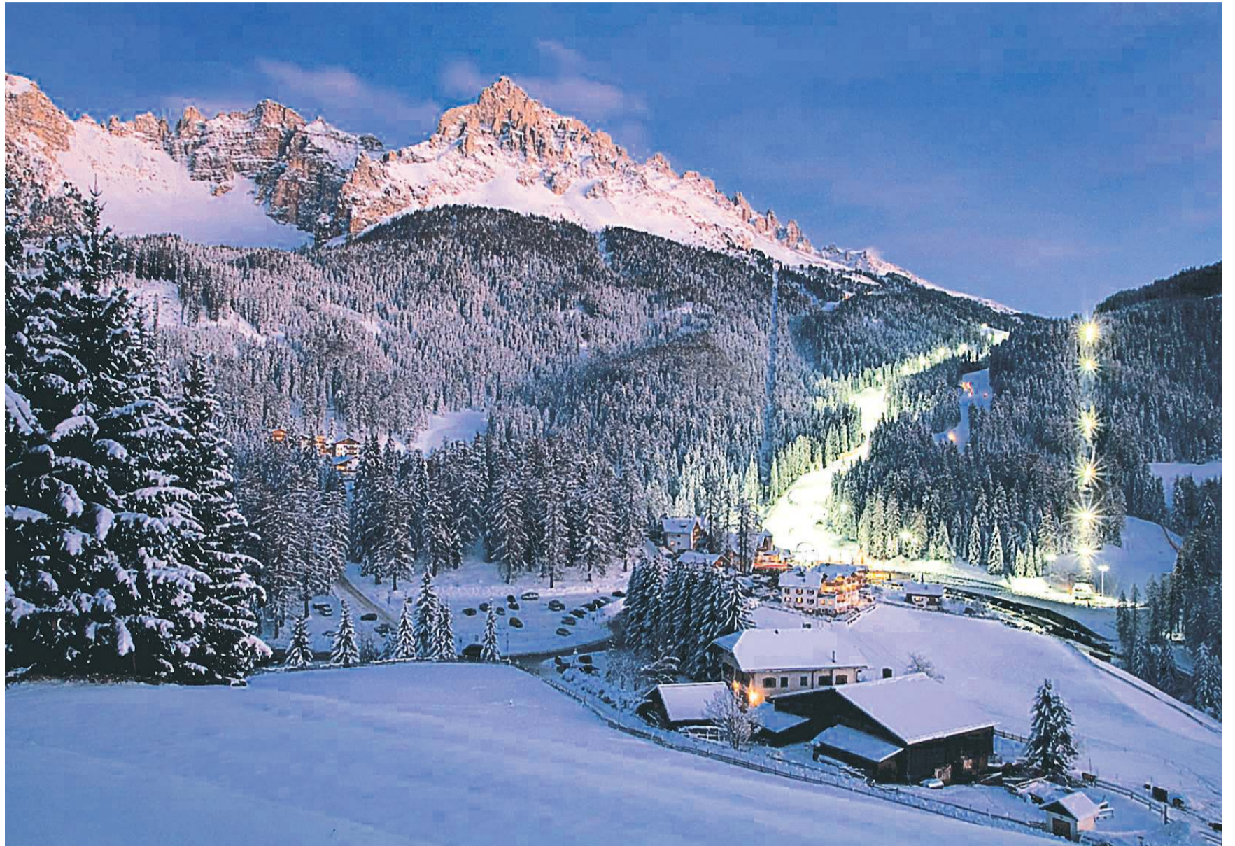
Perle der Alpen: Die Lifte des Skigebietes Latemar bringen die Skifahrer auf 2500 Meter Höhe.

Heute kann der 69-jährige Hotelier, bei dem Ehefrau, Sohn und Tochter im Familienbetrieb mitarbeiten, über die ersten Schritte schmunzeln, vor allem aber ist er stolz auf das Geleistete. Wurden vor 40 Jahren gerade mal 28.000 Gästenachtungen gezählt, so sind es inzwischen 370.000 pro Jahr. An der Talstation der Kabinenbahn Ochsenweide wurde mit stilisier-