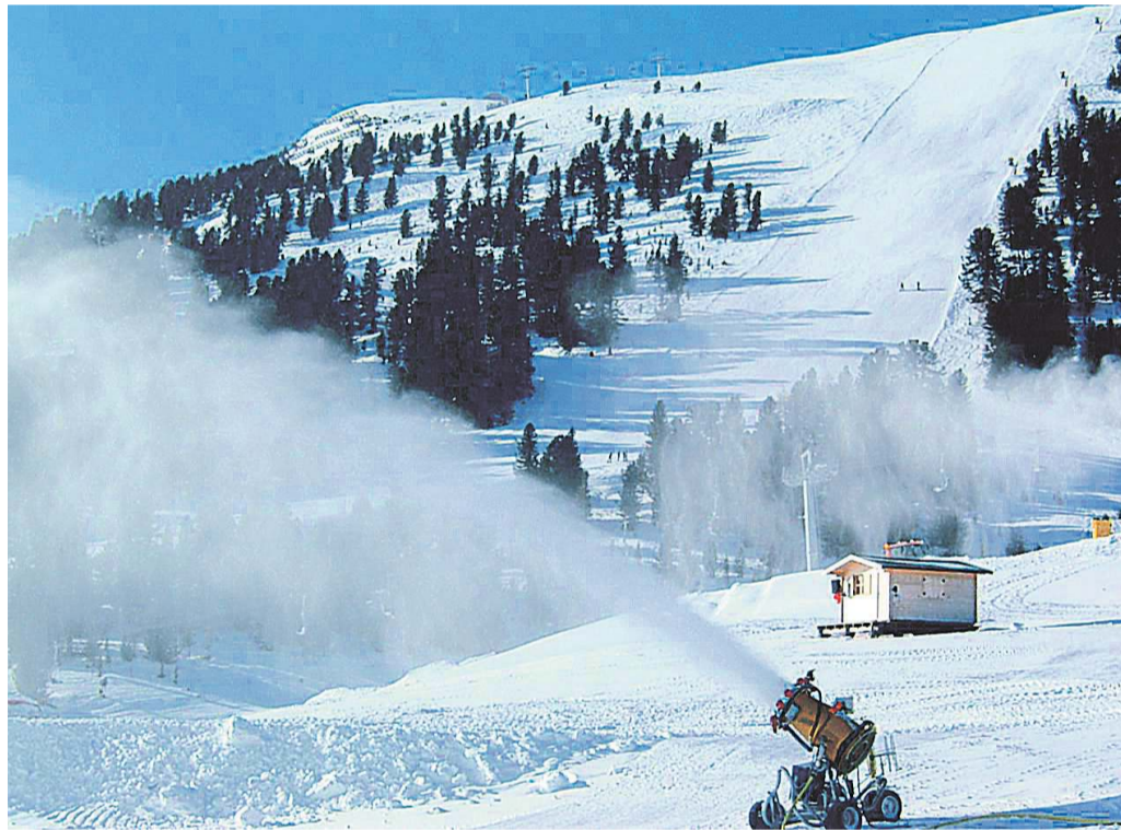
Markenzeichen aus Obereggen: Schneekanonen garantieren das Pistenvergnügen.