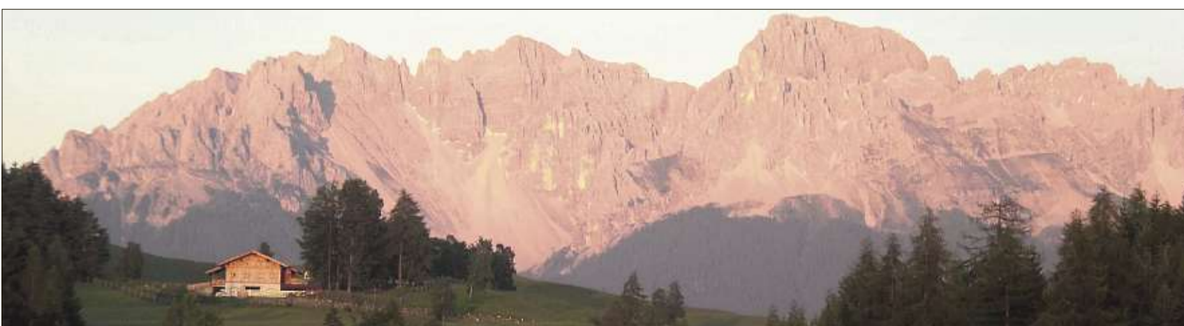
Nicht nur der Rosengarten, sondern auch das benachbarte Latemar „erblüht“ am Abend – von Deutschnofen aus gesehen.