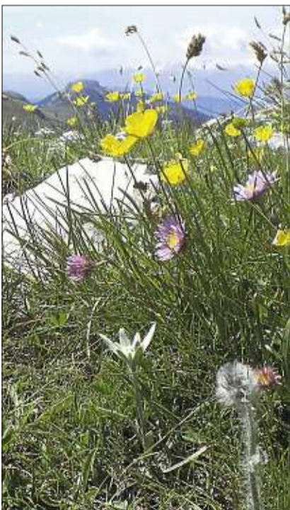
Blühende Landschaften gibt es im Sommer in Südtirol. Enzian, Alpenrosen und sogar Edelweiß (Foto) sind zu finden.