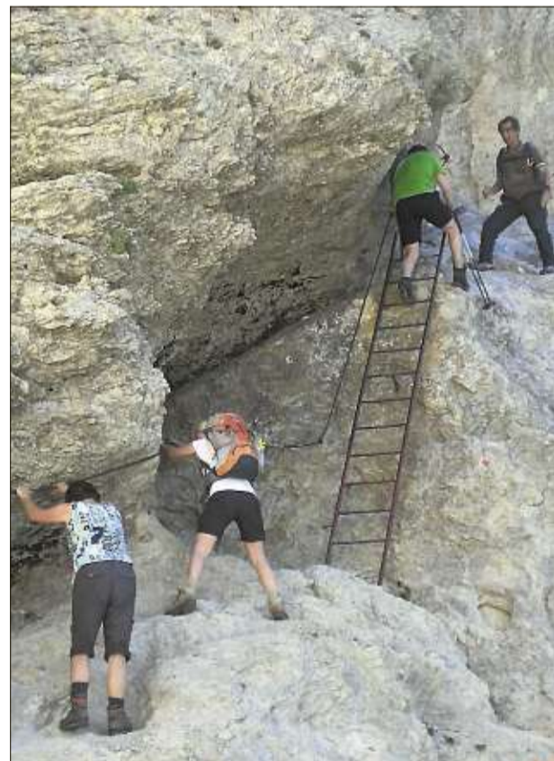
Festhalten bitte: Mit Hand und Fuß den Rosengarten queren. Hier die Passage zum Violonpass mit kurzer Seilsicherung und Leiter. Kann jeder gehen, nur Trittsicherheit, gute Schuhe und etwas Kondition sind erforderlich.

► Latemar-Hütte: Einzige Wanderhütte im Latemar; Auffahrt von Obereggen mit dem Sessellift auf gut 2000 Meter, danach steiler Aufstieg durch Fels, Geröll und Schnee in der Gamsstallscharte zur Torre di Pisa-Hütte (gut 2600 Meter Höhe), wie sie wegen der schiefen Felstürme von Italienern genannt wird. Nach dem steilen Abstieg kann man sich noch in der Maierl-Alm Pasta oder Apfelstrudel gönnen. raus