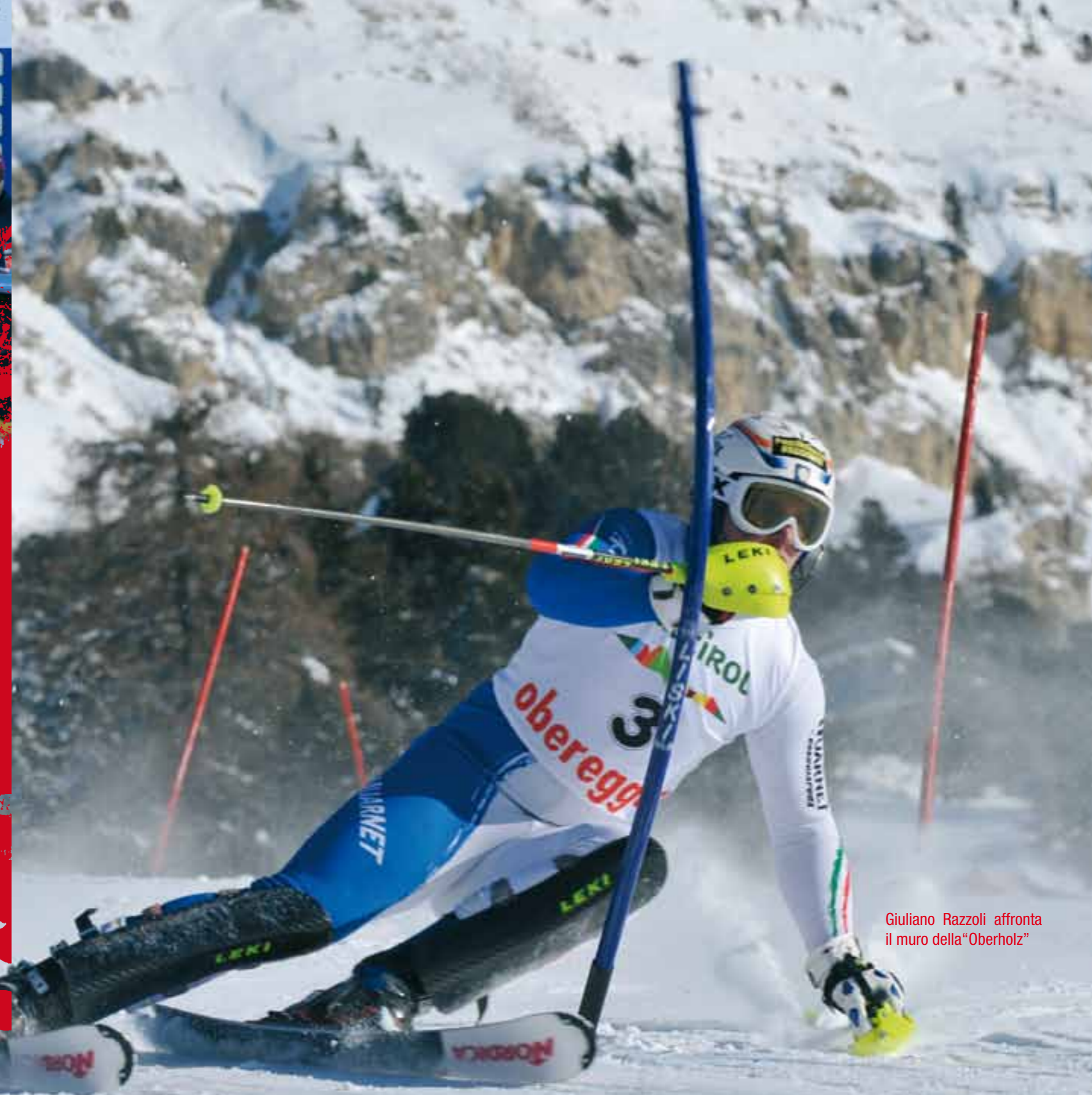
Giuliano Razzoli affronta il muro della "Oberholz"