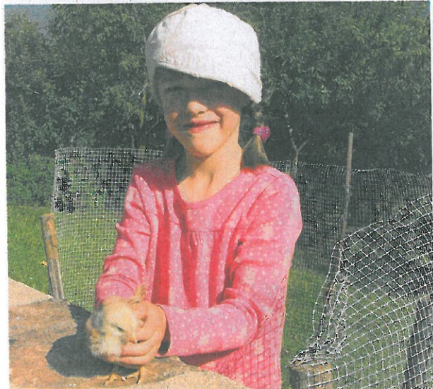
Ferien auf dem Bauernhof: Auf Du und Du mit den Tieren.

Ihre Mutter kochte auf Wunsch sogar für die Fremden. Das allerdings überlässt Maria ihren Gästen in den beiden bestens ausgestatteten Wohnungen. Die wurden vor zwei Jahren komplett neu gebaut. Es fehlt an nichts, selbst die Versorgung läuft nach Bedarf über den Hof. Gemüse aus dem eigenen Garten, Eier aus dem Hühner- und zur Freude aller Großstadtkinder auch schon mal Milch direkt aus dem Kuhstall. Selbst der Speck stammt von den hofeigenen Schweinen, die einmal ein zufriedenes Leben führten.